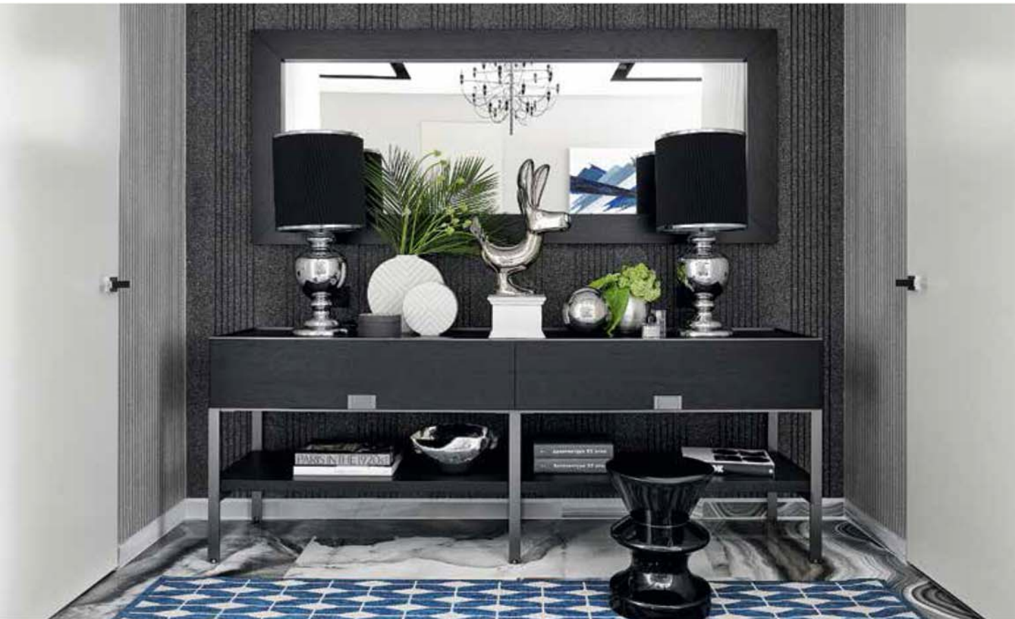
Вверху: Консоль, диз. А. Читтерио, Maxalto. Зеркало изготовлено на заказ по эскизам автора проекта. Обои Omexco. Статуэтка Superego. На полу керамогранит Alabastrі от компании Rex. Внизу слева: Стол Mirto, диз. А. Читтерио для V&B Italia, сочетает черный хром и мрамор Nero Marquina. Стулья Solo в черной коже — тех же авторов. Радиатор-зеркало Arbonia. Обои Omexco. Ваза Vanessa Mitrani Creations. Внизу справа: Кухня Veneta Cucine с фасадами из стекла. Фартук: закаленное стекло. Техника Küppersusch. Смесители KWC. Декор MHLiving.