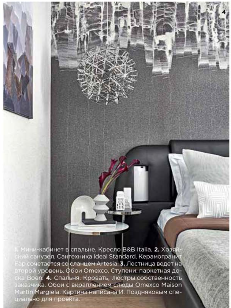
1. Мини-кабинет в спальне. Кресло V&V Italia. 2. Хозяйский санузел. Сантехника Ideal Standard. Керамогранит Фар сочетается со сланцем Artesia. 3. Лестница ведет на второй уровень. Обои Omexco. Ступени: паркетная доска Voent. 4. Спальня. Кровать, люстры: собственность заказчика. Обои с вкраплением слюды Omexco Maison Martin Margiela. Картина написана И. Поздняковым специально для проекта.